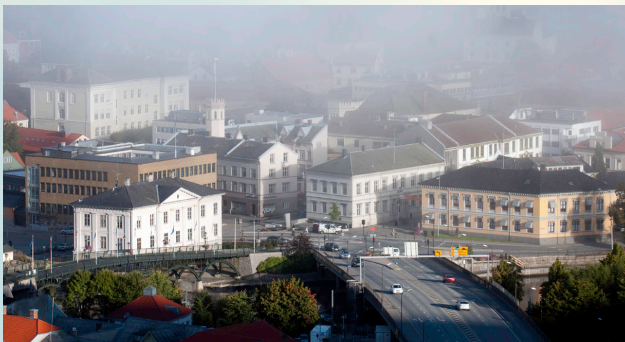
Wiels Plass og rådhuset sett fra Fredriksten festning.

*Hassingveien 40 Eiendom AS ble solgt i 2018.