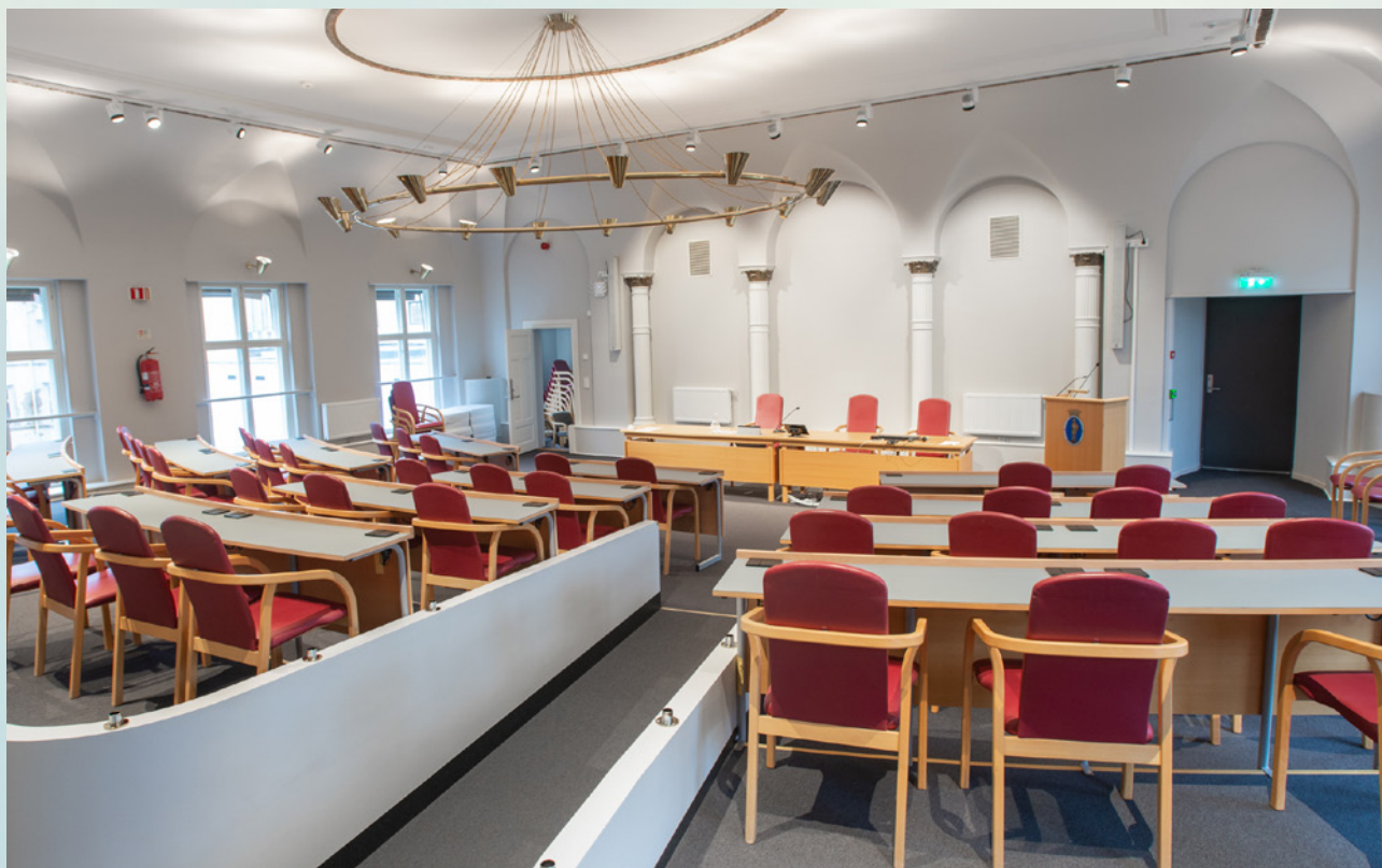
Pensjonskassen har investert mye i det gamle rådhuset, og eiendommen fra 1819 framstår i dag som tidsriktig og funksjonell.

Avkastningen i norske høyrenteobligasjoner var god i 2018 til tross for fallende aksjemarkeder. Normalt er det høy grad av korrelasjon mellom aksjer og høyrenteobligasjoner, men høyrenteplasseringene oppnådde en avkastning på 4,44% samtidig som det norske aksjemarkedet falt 2,20 %. Andelen høyrenteobligasjoner består ved årsskiftet kun av et norsk